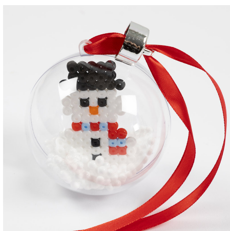
5 Lukk kulen og fest et bånd til pynten.