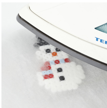
2 Stryk figurene på bomullsvarme.