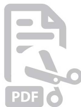
Sjablong Print sjablongen her.