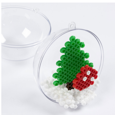
4 Plasser de to trærne tilfeldig inne i kulen.