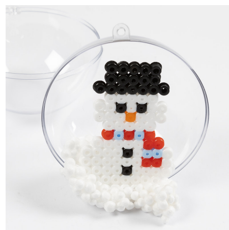
3 Åpne kulen og legg et lag Foam Clay® på bunnen. Sett figuren godt ned i leiren.