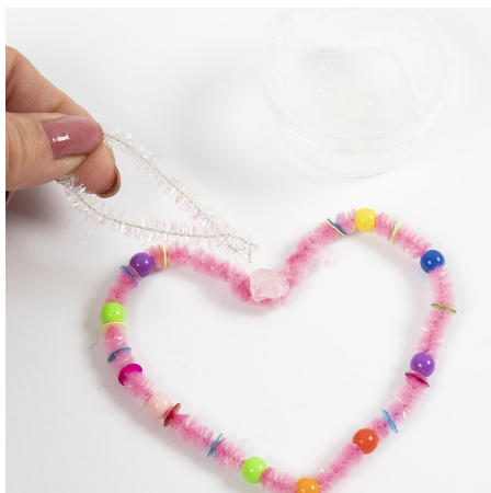
2 Vri sammen endene av hjertet. Klipp et stykke piperenser til opphenget og vri det på hjertet.