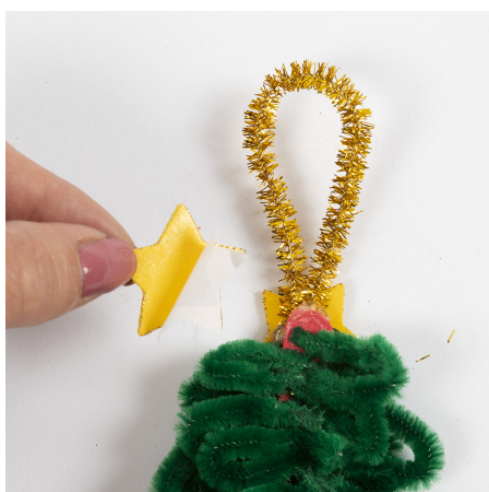
5 Klipp et ca. 10 cm langt stykke av gullpiperenseren. Fest den til toppen av treet med Sticky Base og sett en selvklebende stjerne på hver side.