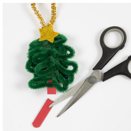
6 Kutt stammen til ønsket lengde.