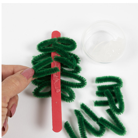
4 Brett piperenserbitene og fest dem på begge sider av EVA-skumpinnen med Sticky Base.